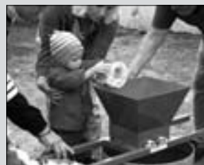
Oviszüret (5. oldal)