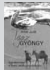
Igaz Gyöngy (8. oldal)