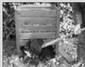
Lombkomposztálás (8. oldal)