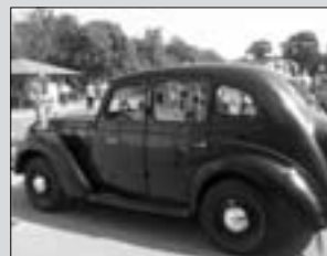
Veterán autók Devecserben (3. oldal)