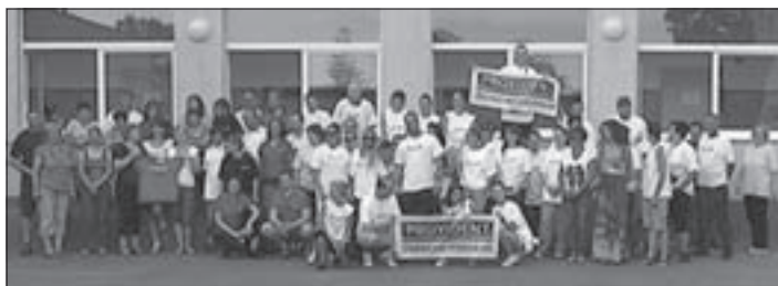
Az önkéntesek csapata

Az Amerikai Kereskedelmi Kamara Alapítvány önálló szervezetként 2001 óta működik, hogy egy felelősebb üzleti gondolkodásmódot honosítson meg Magyarországon. Az Alapítvány célja, hogy váratlan természeti katasztrófa, egészségügyi vagy szociális helyzet miatt segítsé-