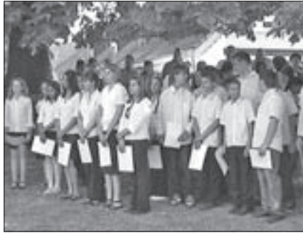
2010/2011-es tanév ösztöndíjasai

Remélhetőleg nem sokszor kerül már ilyen jelző településünk iskolájának tanévzáró rendezvénye elé. De hogyan is jellemezhető egy olyan záróesemény az iskola életében, ahol az igazgatónő beszédének kezdeteként azt mondta: „túléltük a tanévet”.