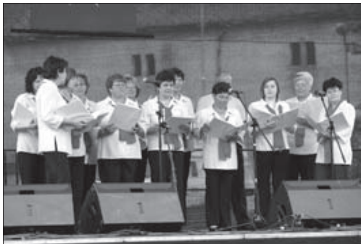
Lyra vegyeskar – Somlósárhely