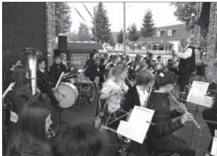
Devecseri Ifjúsági Fúvószenekar