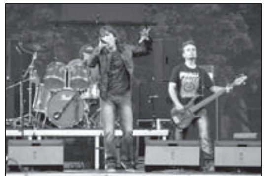
Bon Jovi Tribute Band