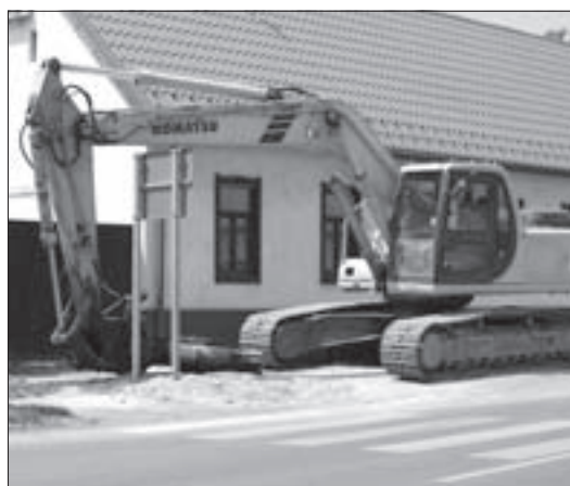
Megszokott látvány Devecserben