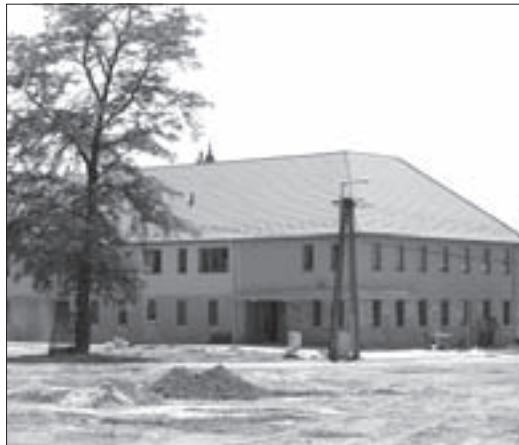
„A város északi kapuja”