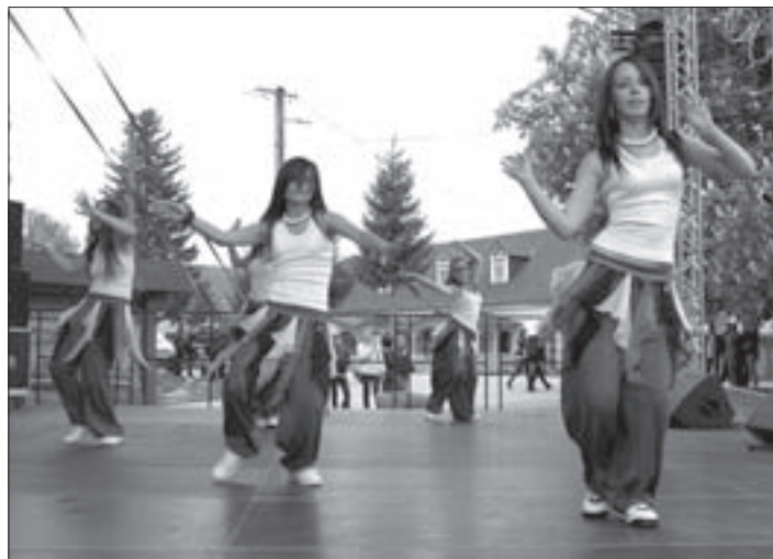
Step 5 – Kolontár