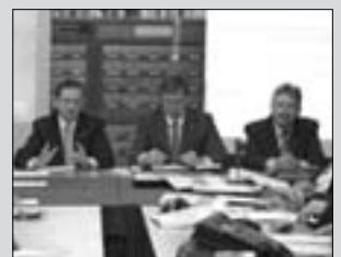
Szászországi segítség 10. oldal