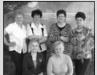
Búcsú az óvodától 5. oldal