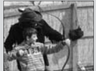
Kirándulás a kalandparkba 4. oldal