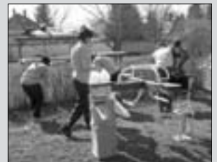
A közös munka öröme 7. oldal